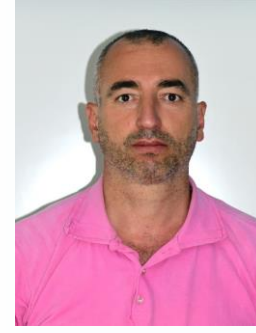
SENER KİT. MEMUR